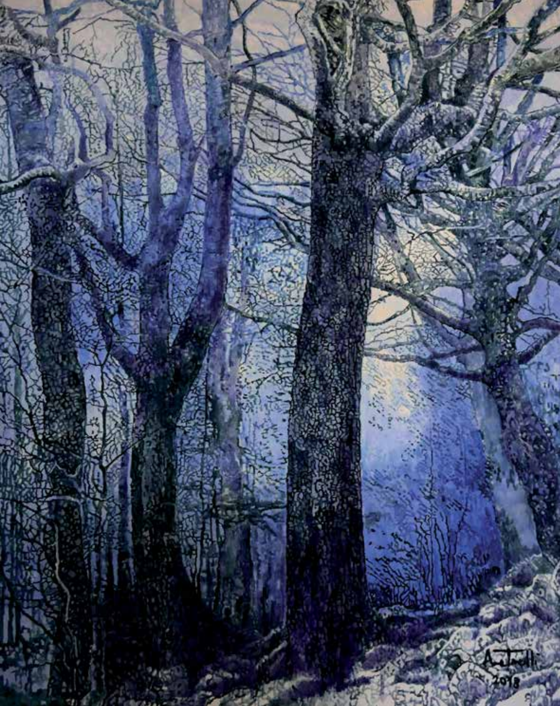
Alberi che parlano, olio su tela 120x150 - 2018