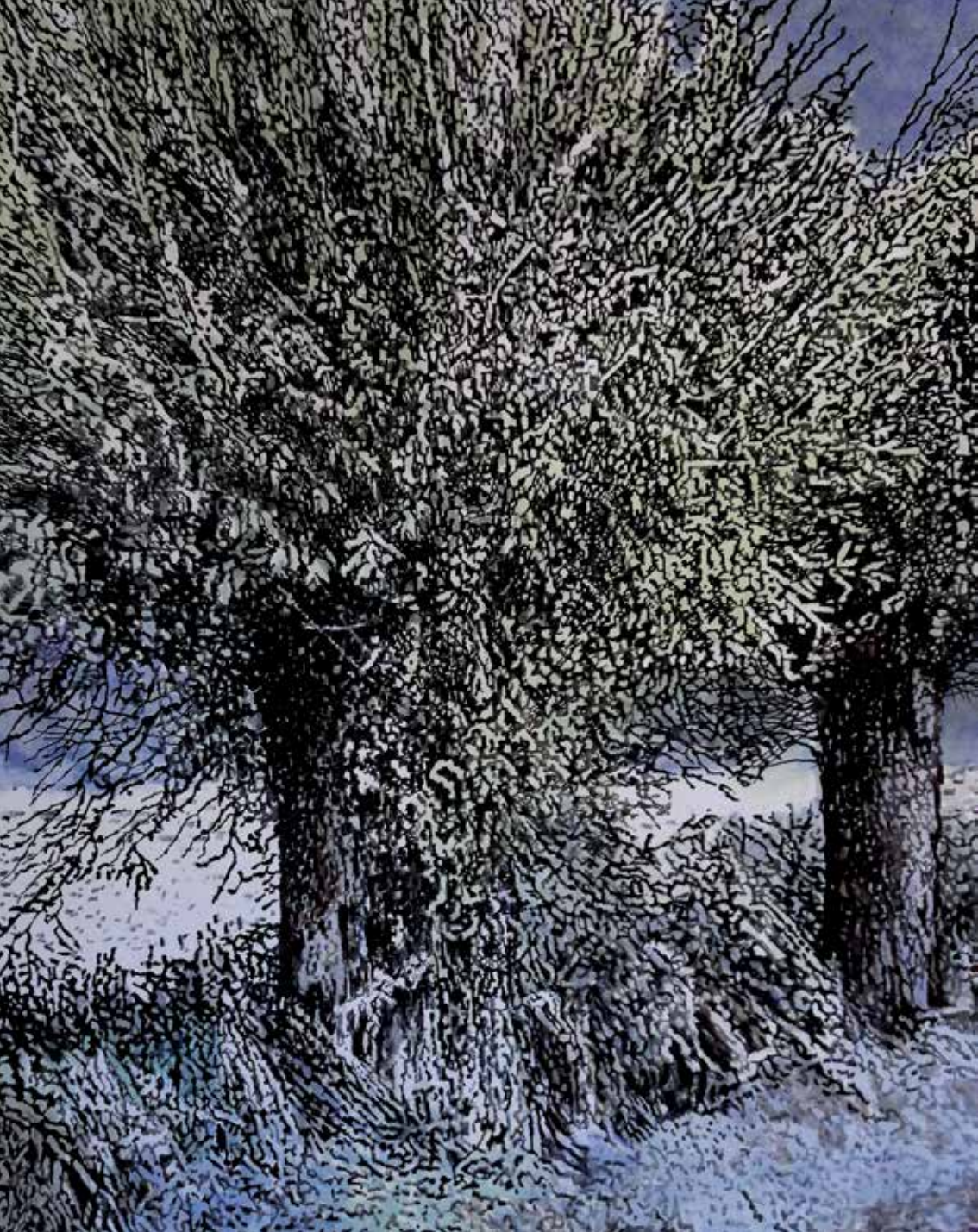
Salix Viminalis primavera, olio su tela 120x150 - 2021