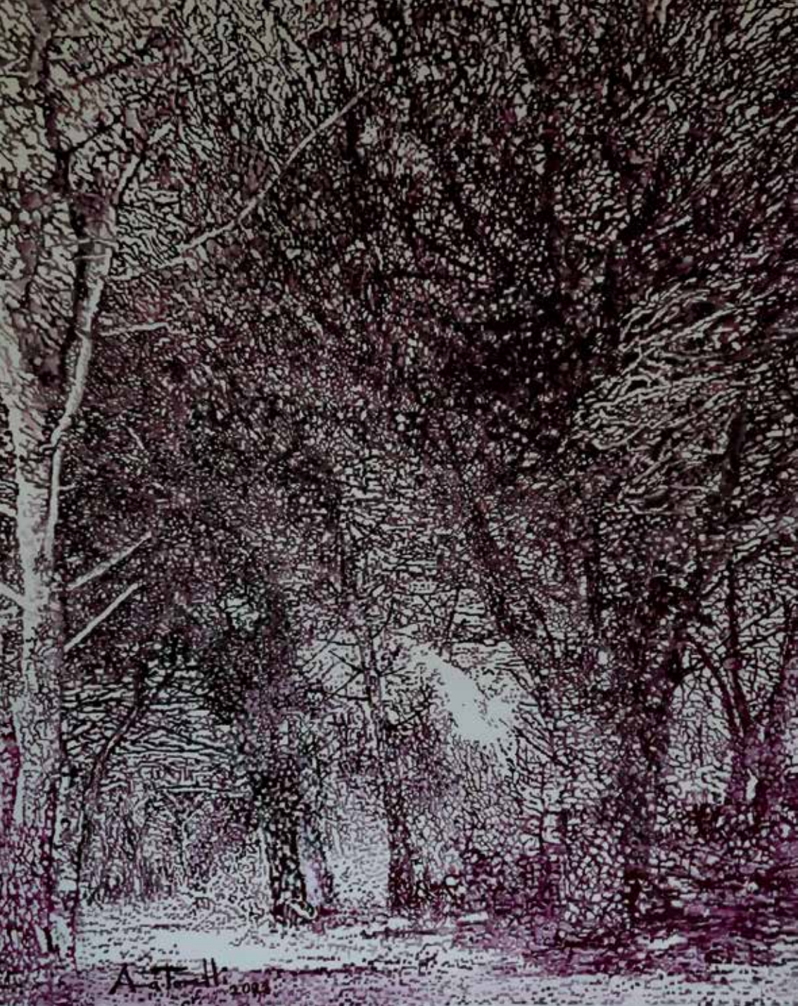
Bosco rosso, olio su tela 120x150 - 2021