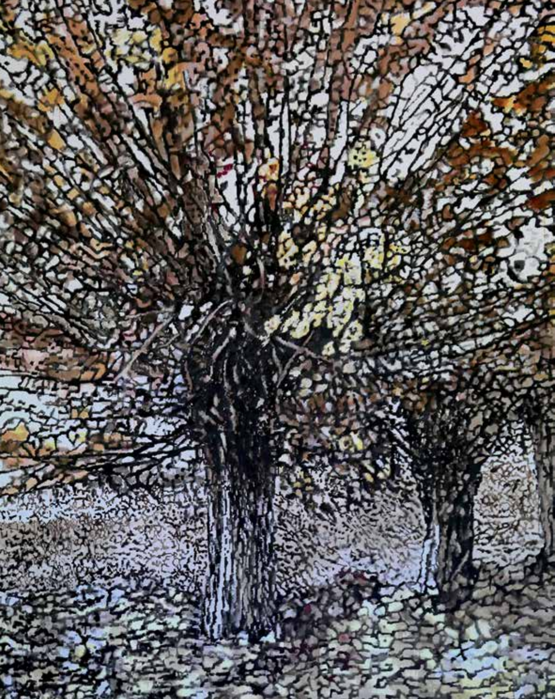
Salix Viminalis, autunno, olio su tela 120x150 - 2021