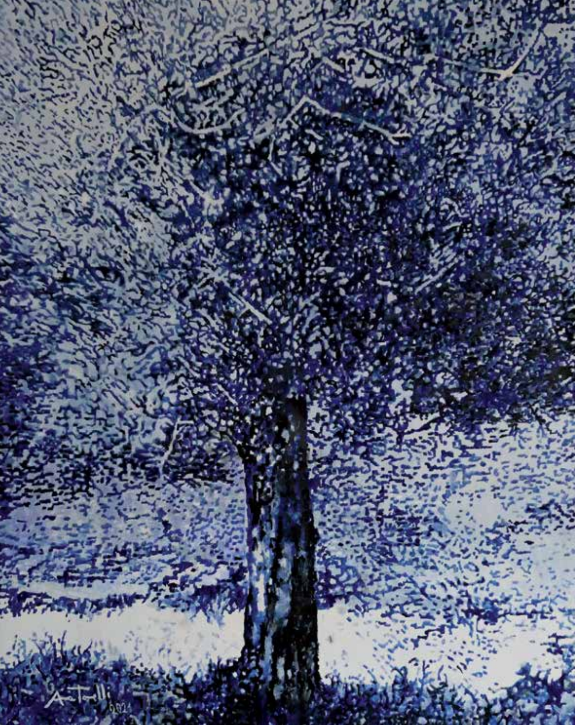
Albero blu, olio su tela 120x150 - 2021