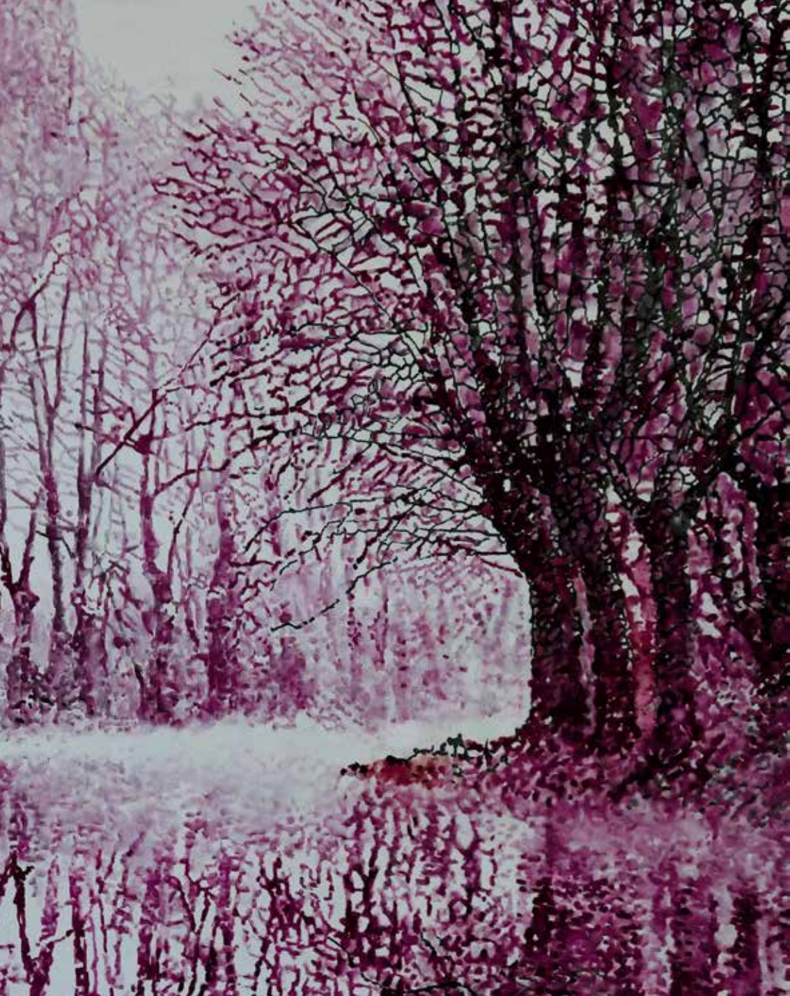
Magica atmosfera, olio su tela 50x70 - 2021