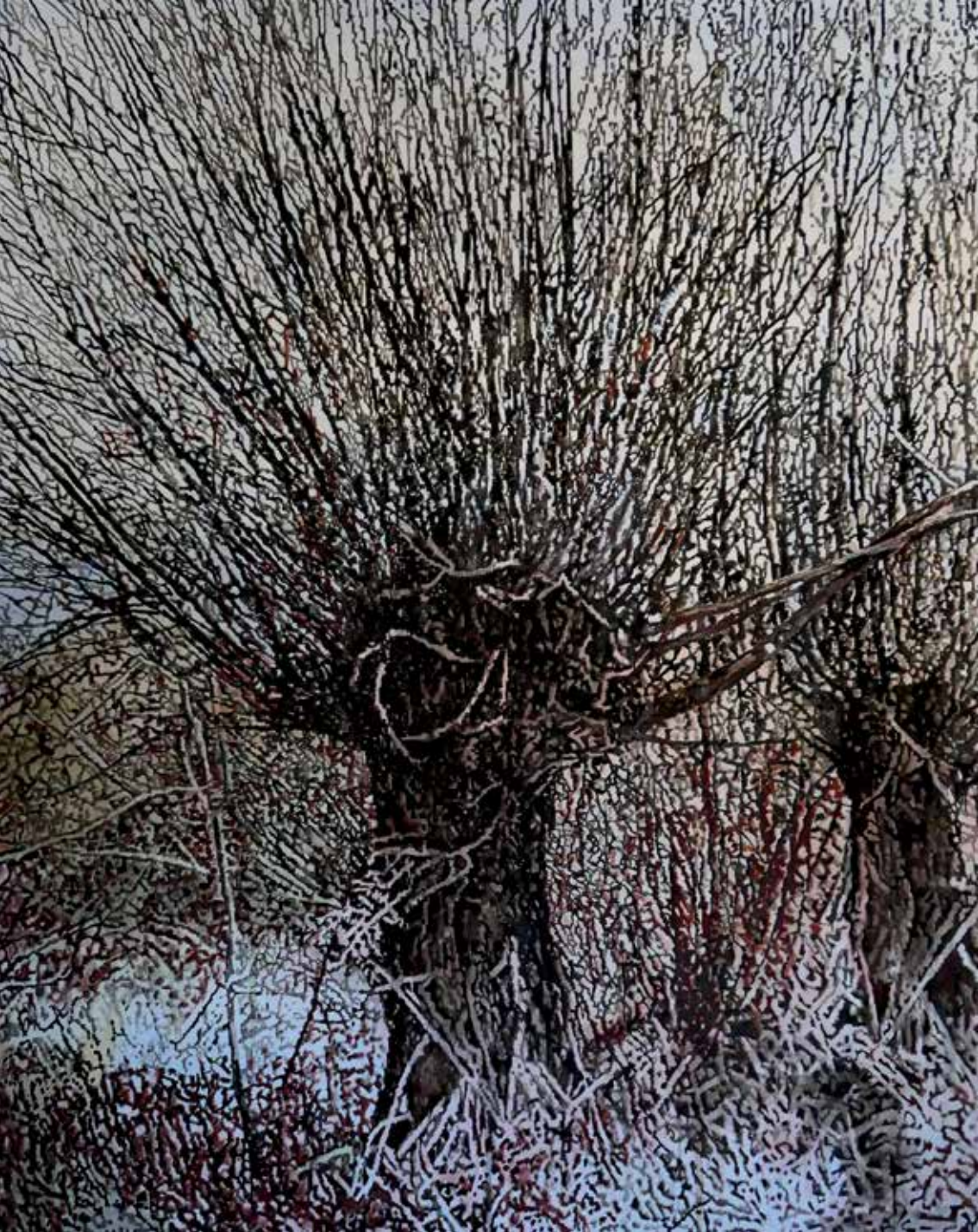
Salix Viminalis estate, olio su tela 120x150 - 2021