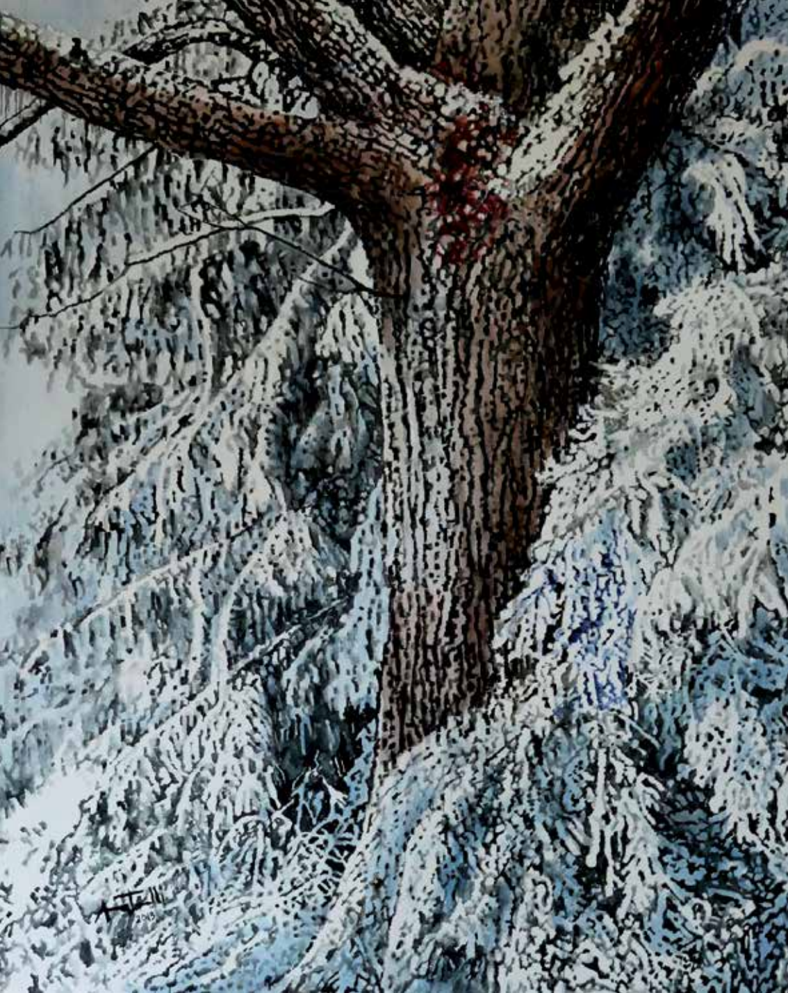
Cuore d'inverno, olio su tela 120x150 - 2019