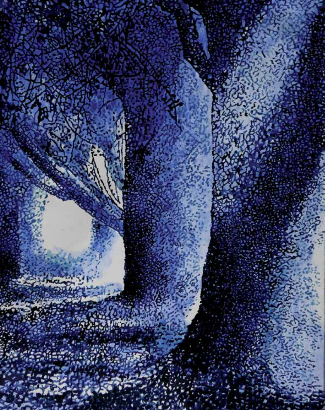
Alba azzurra, olio su tela 50x70 - 2021