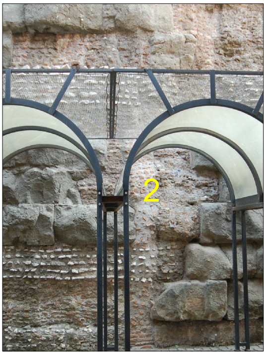
TRACCIA CON RIPRESA MURARIA