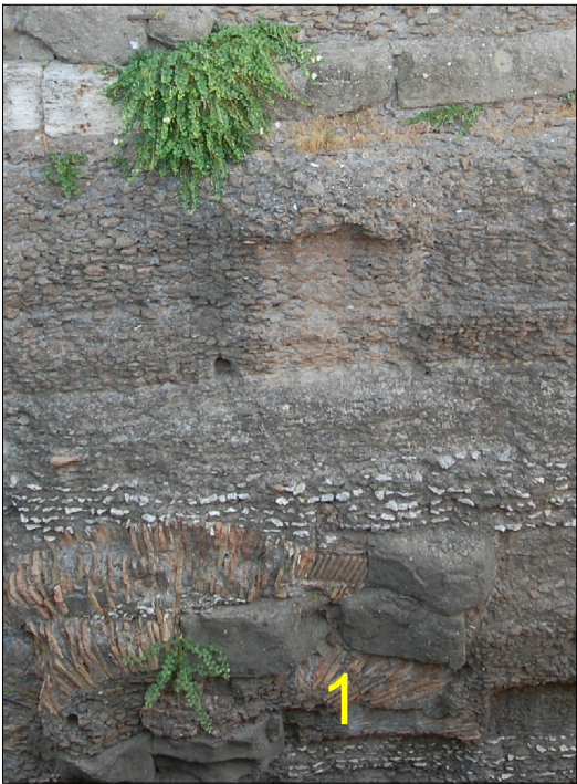
ARCO DI SCARICO IN LATERIZIO CON RICORSI DI BIPEDALI